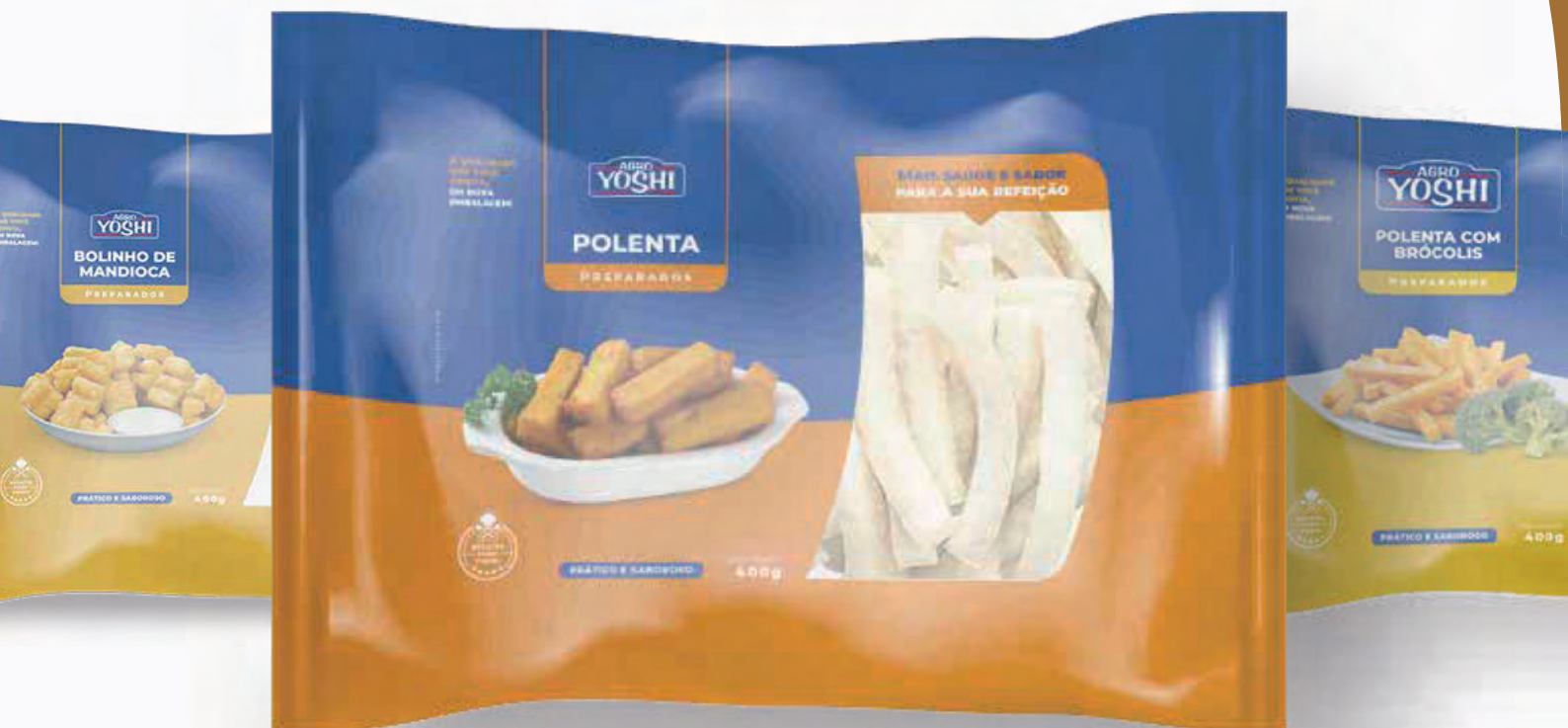
BOLINHO DE MANDIOCA 400G