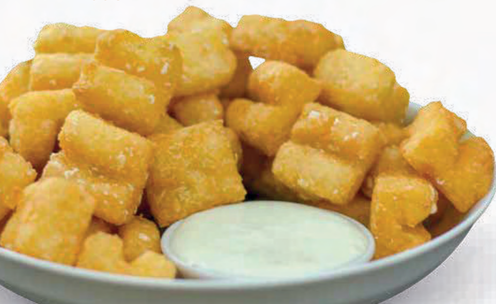
POLENTA COM BRÓCOLIS 400G